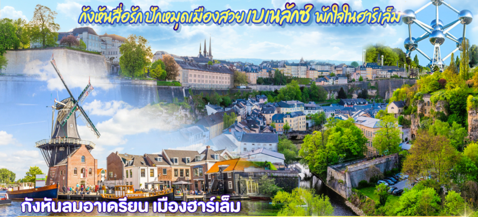
กังหันลมอาครियิน เมืองฮาร์ลิม