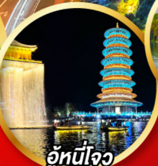
อู่หนี่โจว