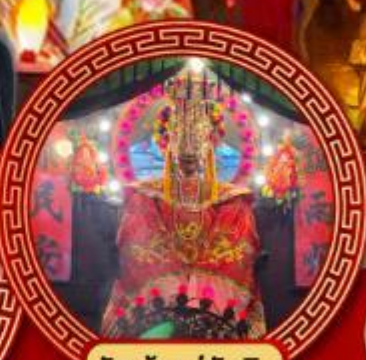
วัดเจ้าแม่ทับทิม