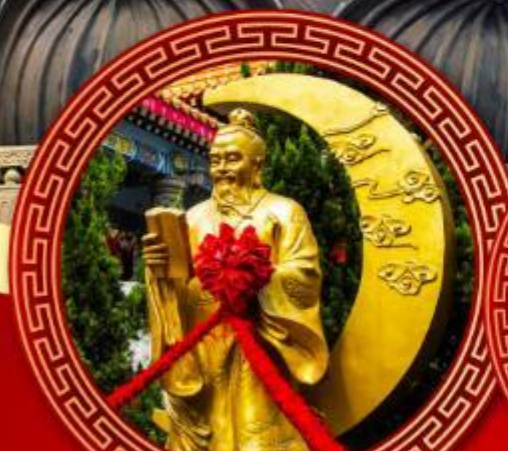
วัดหวังต้าเซียน