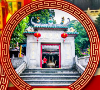
วัดอามา่า