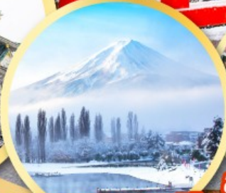
ทะเลสาบคาวากุจิโกะ