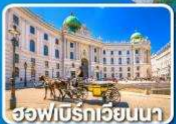
ฮอฟเบิร์กเวียนนา