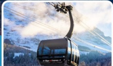
กระเช้า ไอเกอร์เอ็กเพรส สู่จุงเฟรา

อิตาลี สวิตเซอร์แลนด์ ฝรั่งเศส 10 วัน 7 คืน