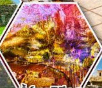
น้ำพอร์บรีอุส