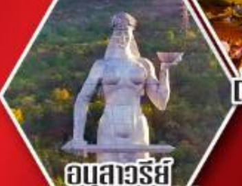
อนุสาวรีย์ มารดาแห่งจอร์เจีย