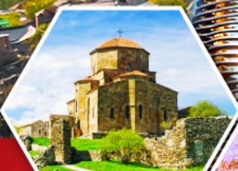
วิหารจอร์