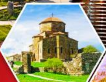
วิหารลอรี