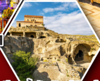
เมืองเก่าอพลิสต์ซิคเคห์

พัก Rooms Hotel โรงแรมวิสาหกิจของเทือกเขาคอเคซัส