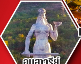
อนุสาวรีย์ มาร์ตาแห่งจอร์เจีย