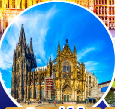
มหาวิหารแห่งโคโลญ