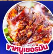
ฟาหมูเยอร์มิน