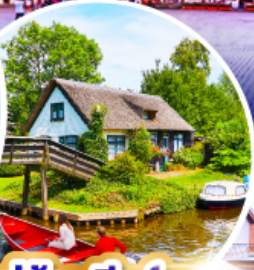
หมู่บ้านกีธูร์น