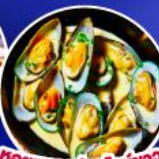
หอยแมลงภู่นิวอิงา