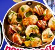
หอยเอสชาร์โก