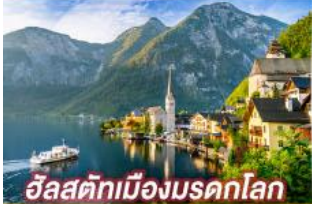
อิลสติกเมืองมรดกโลก