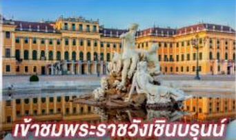
เข้าชมพระราชวังฮินรุนน์