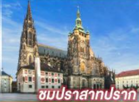
ชมปราสาทปราท