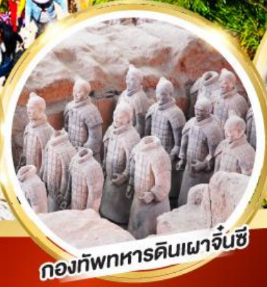
กองทัพทหารดินเผาจีนซี