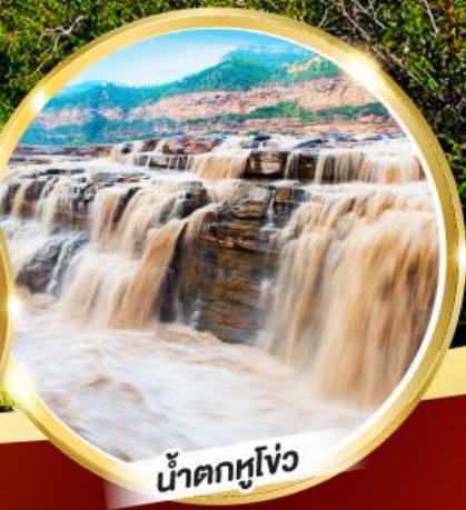
น้ำตกหูโง่