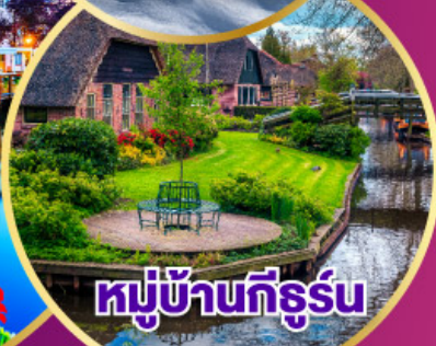
หมู่บ้านทีร์รูน

เดินทาง 30 เม.ย.-09 พ.ค. 68 03-11 พ.ค. 68