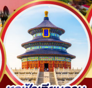
หอฟ้าเทียนถาน กำแพงเมืองจีน