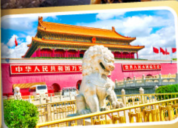
จตุรัสเทียนอันเหมิน