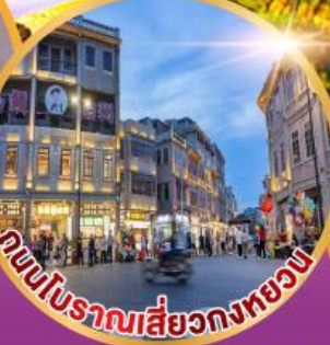
ถนนโบราณเสี่ยวกงหยวน