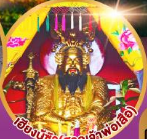
เอ็งบูซิว (ศาลเจ้าพ่อเสือ)

เมนูพิเศษ!! อาหารแต่จิว 18 อย่าง ผ่านพะไลต้นตำรับชัวเถา สุกีชีฟู๊ด