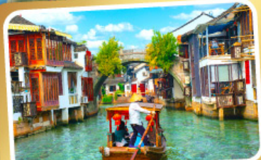
ล่องเรือเมืองโบราณซูเจียเจียว