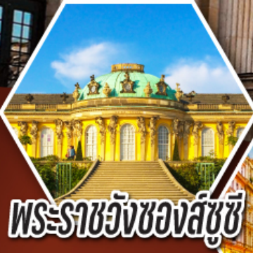
พระราชวังของส์ซุซี