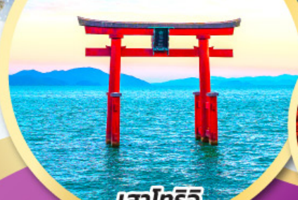
ทะเลทริอิ