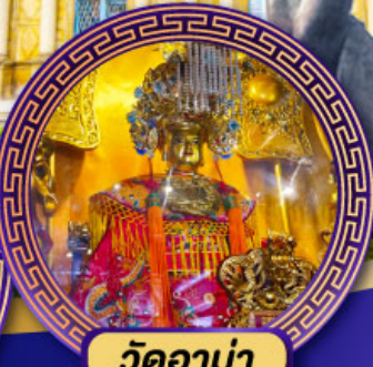
วัดอาเมา