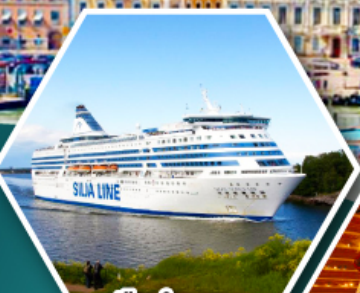
เรือสำราญ TALLINK SILJA LINE