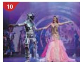
10 Zodiac Theatre Enjoy live production shows from the acclaimed award-winning entertainment team.