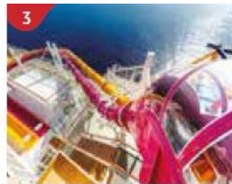
3 Waterslide Park Get drenched in fun on one of our six different waterslides.