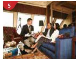
5 The Palace Indulge in European-style butler service and exclusive facilities.