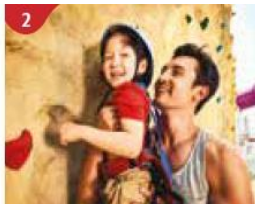
2 Rock Climbing Wall Challenge yourself on our mountainous rock climbing wall.