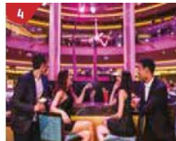
4 Bar 360 Catch live music and aerial acrobatic performances with a glass of champagne.