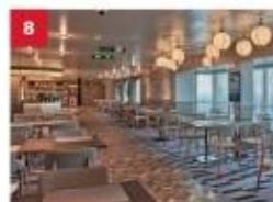
Mozzarella Ristorante & Pizzeria For adventurous foodies, savour a modern fusion of classic Italian dishes and pizzas with a Japanese twist.