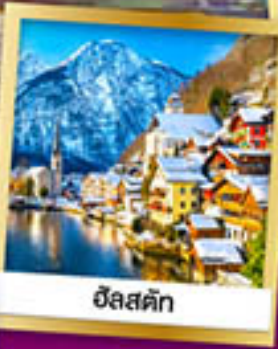
ฮิลส์ตัท