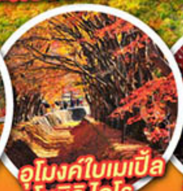
อุโมงค์ใบเมเปิ้ล โมมิจิ โคโร