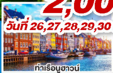
ท่าเรือฮาวน์

ล่องเรือสำราญสุดหรู DFDS พร้อมห้องพักแบบ Sea View