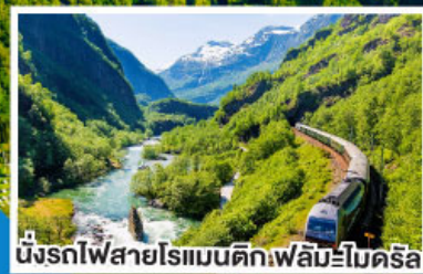
นั่งรถไฟสายโรแมนติกเฟลัมโบโคร์