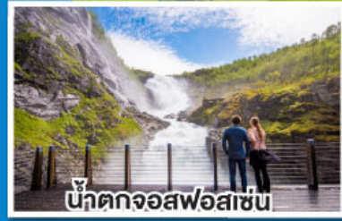
น้ำตกจอสฟอสเซ่น