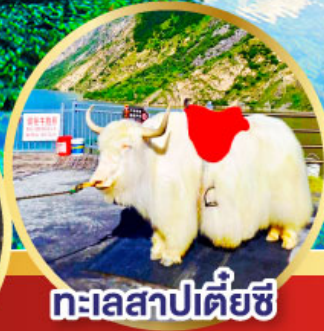
ทะเลสาปเตี้ยซี