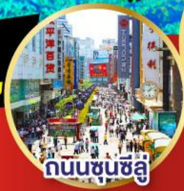
ถนนชุนซี้ลู่