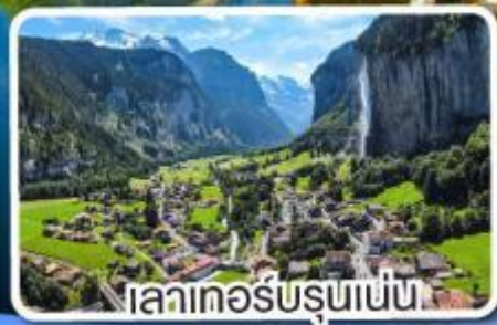
เลาเทอร์บรุนเนน