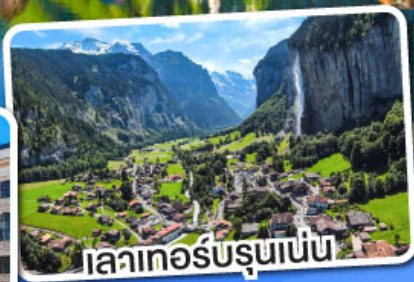
เลาเทอร์บรุนเนน