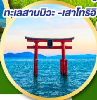
วัดคิตสึโอจิ(วัดदारุมะ)