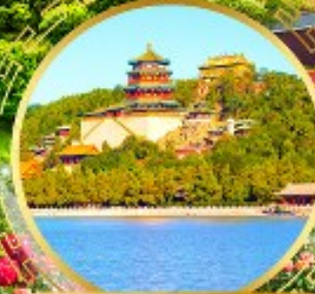
พระราชวังฤดูร้อน