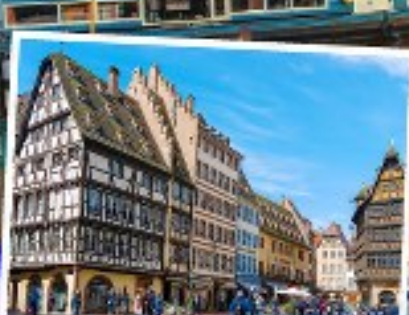
สตราสบูร์ก