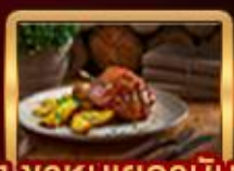
Ribs of Vienna, ปลาเทราสย่าง, ซาหมุยเยอรมัน

ตะลุยพิชิตยอดเขาซูกสปิตซ์ "Top of Germany" เยือนเมืองมิวนิก จัดดูสมาเรียมพลาทซ์ สัมผัสเมืองมรดกโลก เซสท์ ครุมลอฟ เยี่ยมชมปราสาทปราก ย้อนรอยอดีตซาลซ์บูร์ก สวนมิราเบล บ้านเกิดของโมซาร์ท ปราสาทบราติสลาวา มหาวิทยาลัยเซนต์มาร์ติน สุดโรแมนติกส่องเรือชมความงามแม่น้ำดานูบ จัดดูสวีตบุรุษ พระราชวังฮอฟบวร์ก ขึ้นดากับความน่าหลงใหลของ หมู่บ้านริบทะเลสาบฮัลล์สตัดท์ พระราชวังเซินบรุนน์ ปิดท้ายช้อปปิ้งจุใจ