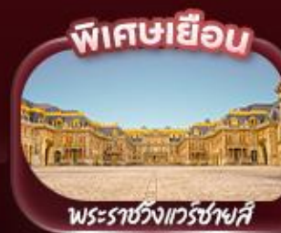
พิเศชเยือน