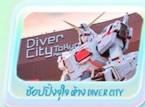
ช้อปปิ้งจุใจ แห่ง DIVER CITY