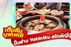
เดิมนมบุฟเฟ่ต์ ปิ้งย่าง Yakiniku สดร้อนญี่ปุ่น

22-26 พ.ค. 69 / 29 พ.ค.-02 มิ.ย. 69 17-21 มิ.ย. 69 / 26-30 มิ.ย. 69