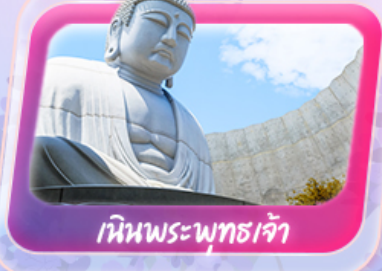
นีนพระพุทธรเจ้า