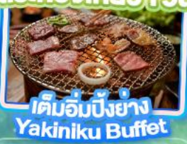
เติมอัมปียงย่าง Yakiniku Buffet