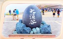
ซุบซาโด้ถ้ำอิวาคุดานิ