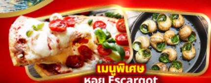
เมนูพิเศษ หอย Escargot Pizza Margherita 1 ถาด

อิตาลี มหาวินาศดูโอโม ชมสิ่งมหัศจรรย์โลก โคโลสเซียน หอเอนปิซ่า สวิส พิธีชงชาของเฟร่า "TOP OF EUROPE" สะพานไม้ชาเปล รูปปั้นสิงโต ฝรั่งเศส เข็มอินปารีส หอไอเฟล ประตูชัย นั่งรถกระเช้าไฟฟ้ามงต์มาตร์ ล่องเรือแม่น้ำแซนชมเมือง ซุปบิงแบรนต์เนมห้างปลอดภาษี เฮาท์เล็ก