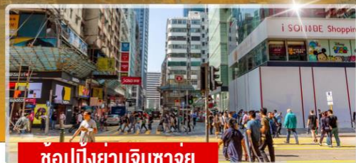
ช้อปปิ้งย่านจิมซาจุ่ย