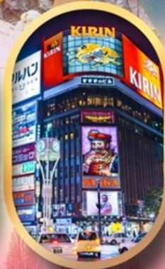
ช้อปปิ้งย่านซูซุกิโนะ