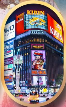
ช้อปปิ้งย่านซูซุกิโนะ