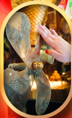
หมอนกั้งหันแซง