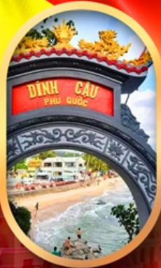
ศาลเจ้าติงเกา