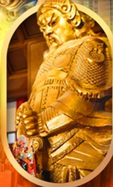
ทองพระวัดแซง

เที่ยว 2 ประเทศ ทoppers วัดดัง ช้อปปิ้งจุใจ