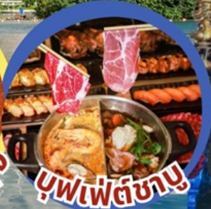
บุฟเฟต์ซาบู