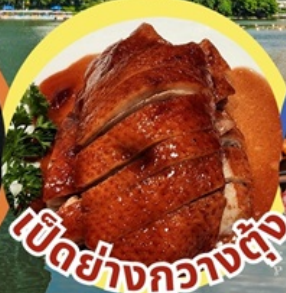
เป็ดย่างกวางตุ้ง