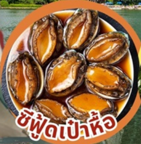
ซีฟู้ดเป่าหื้อ