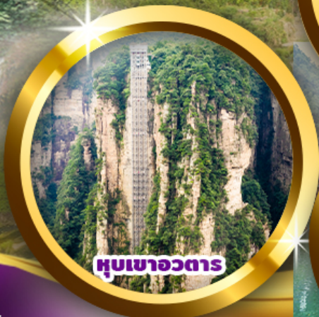
หุบเขาวงตार