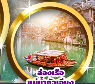
ล่องเรือ แม่น้ำฉางเจี๋ย