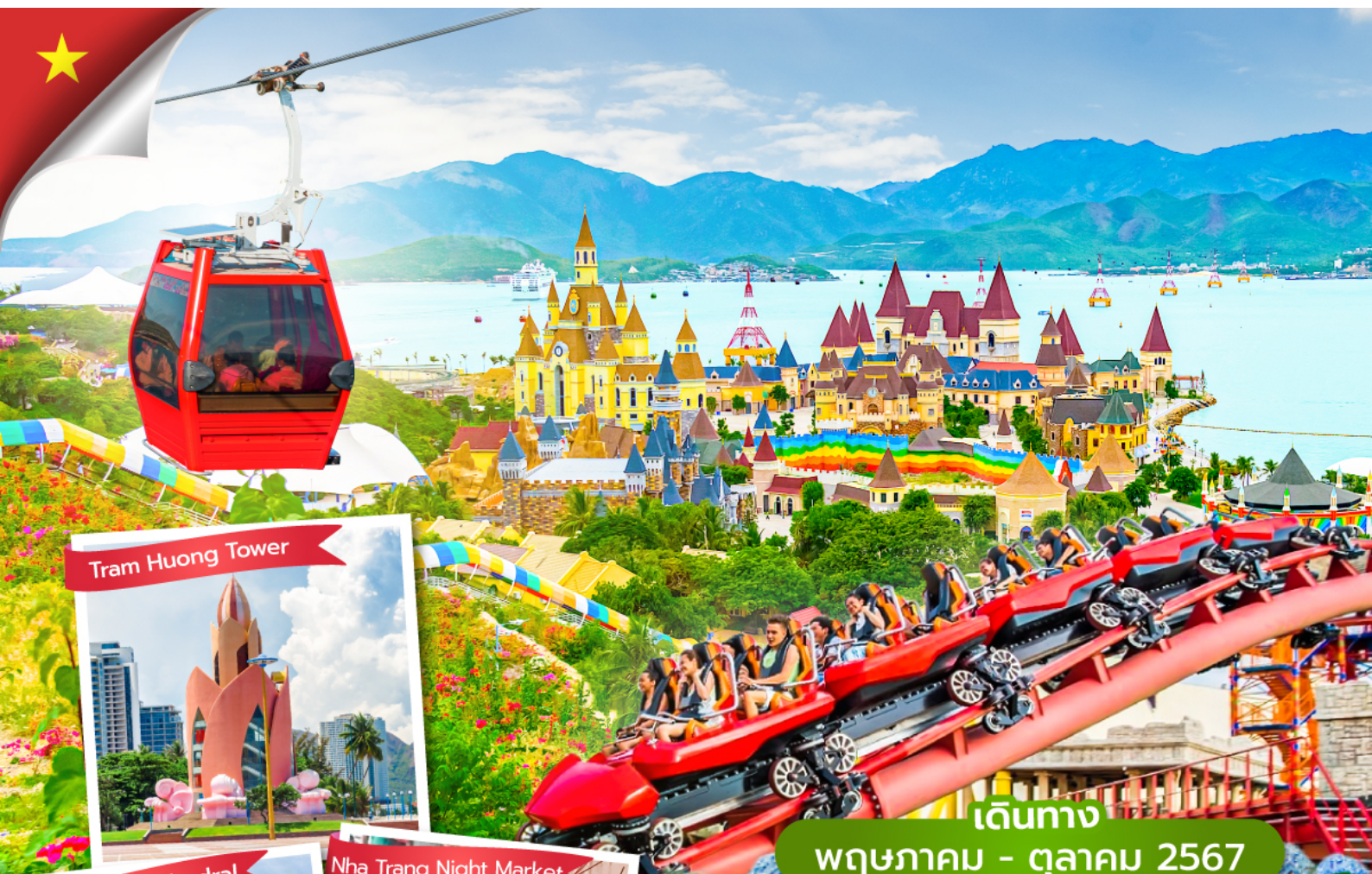
Tram Huong Tower