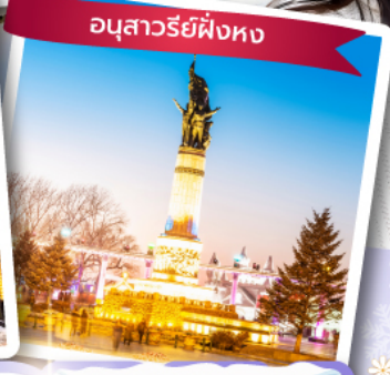
อนุสาวรีย์พิงหง