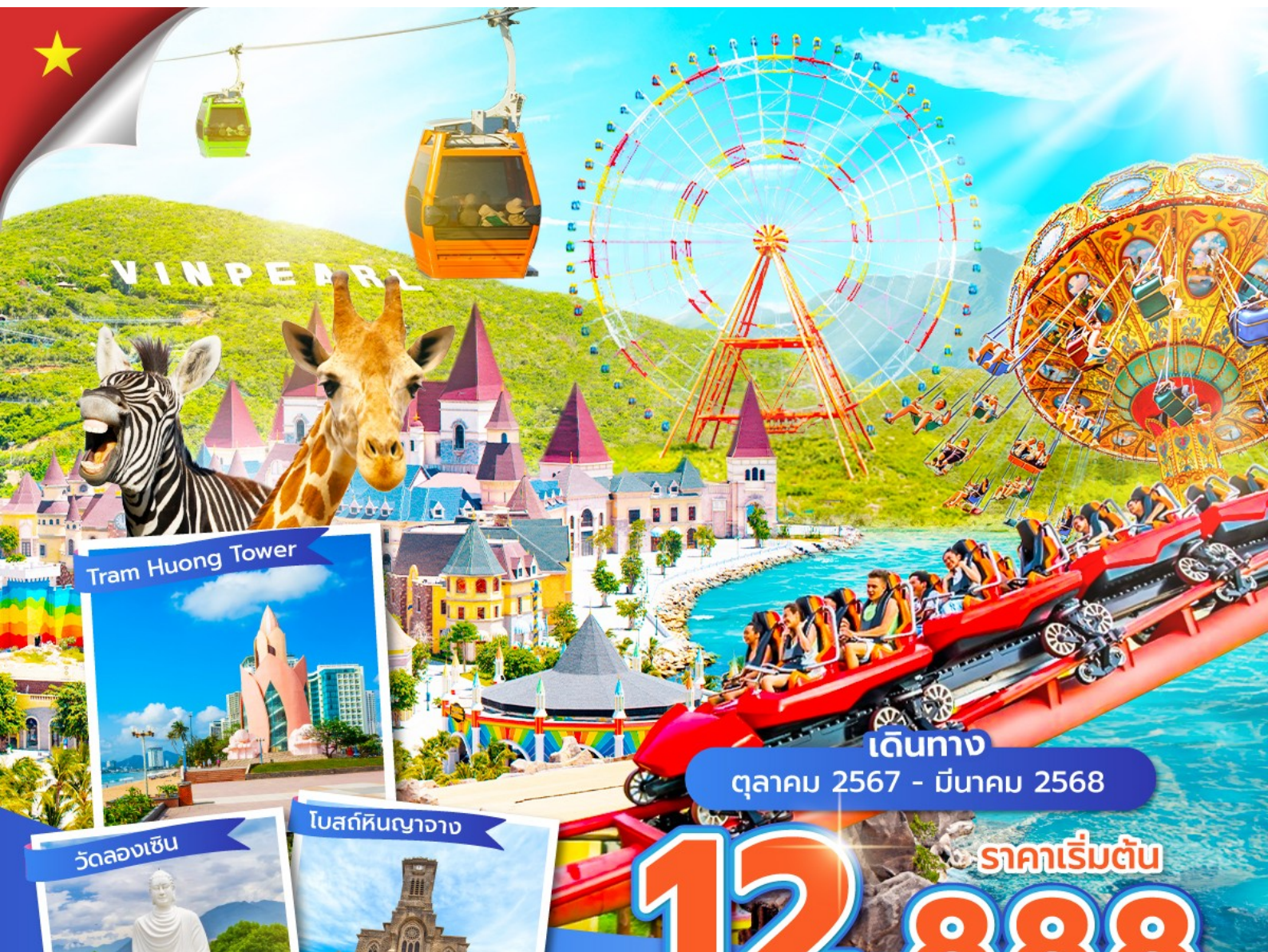
Tram Huong Tower