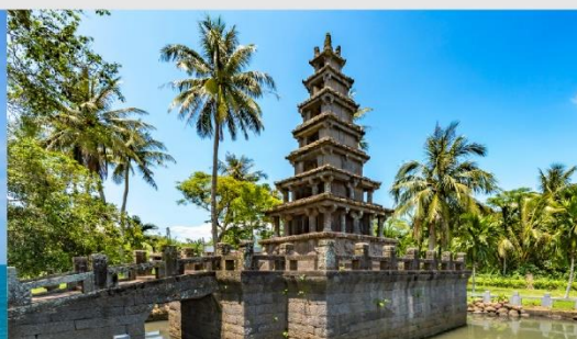
เจดีย์ 2 ฟัน้องหม่ย์หลาน