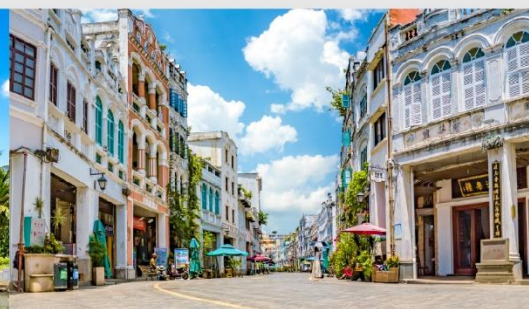
ถนนโบราณฉีไห่ลว

*ทางบริษัทฯ ขอสงวนสิทธิ์ในการสลับโปรแกรมทัวร์ตามความเหมาะสมขึ้นอยู่กับสถานการณ์หน้างาน โดยคำนึงถึงผลประโยชน์ของลูกค้าเป็นสำคัญ