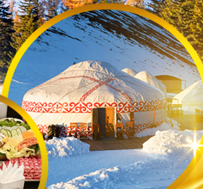
พักแคมป์ส่วนตัว