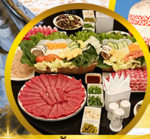
สุกัมองโกล