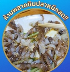
หามพลาดชิมปลาหมึกสด!!