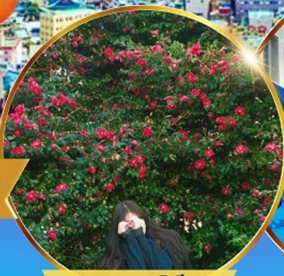
ชมดอกคามิเลีย